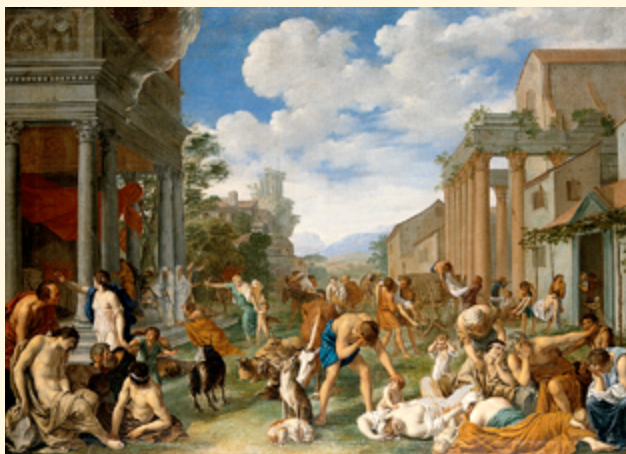
«Чума среди филистимлян в Ашдоде», Питер ван Хален, 1661