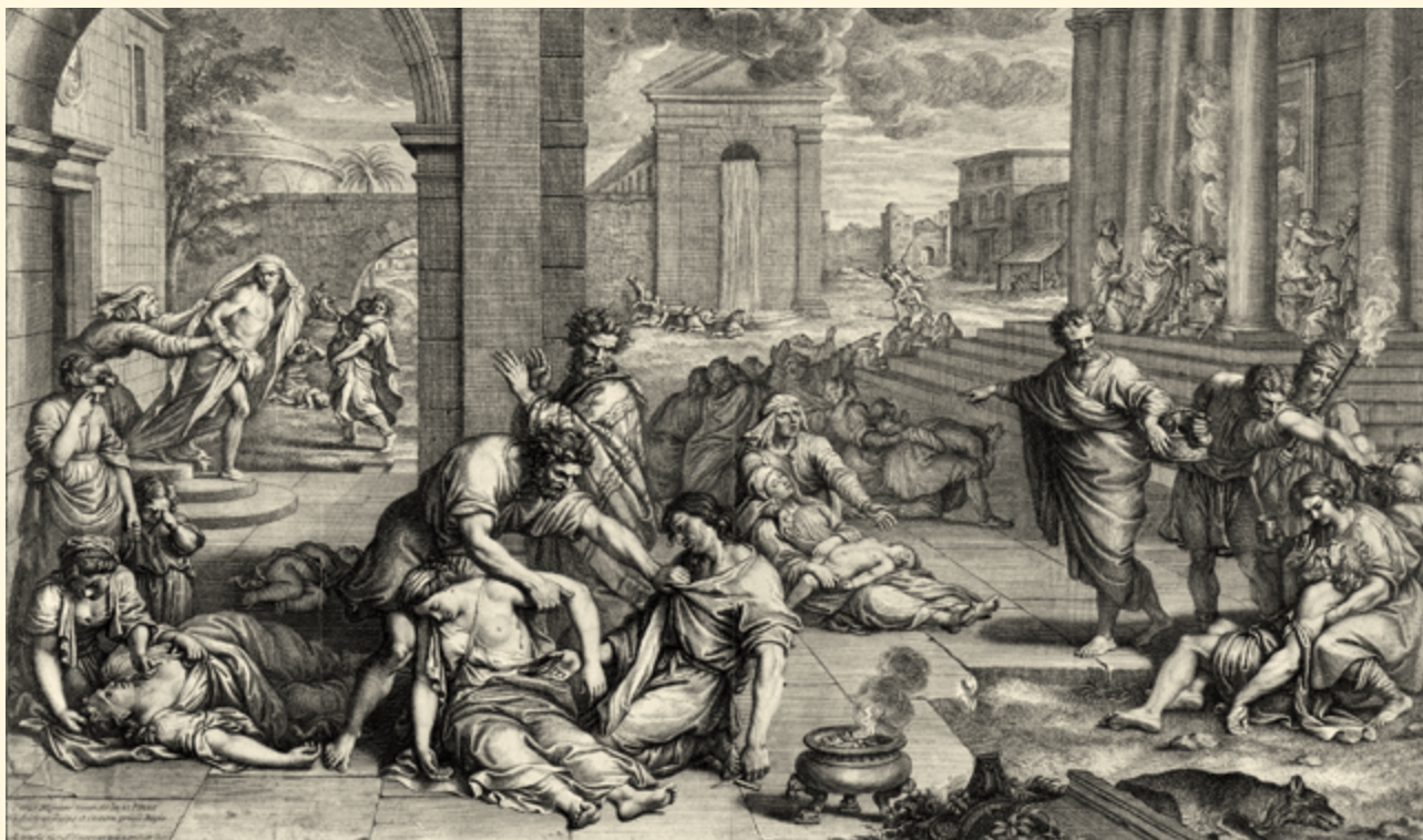
Первая в истории человечества пандемия — Юстинианова чума — вспыхнула в 541 году в правление императора Юстиниана

Юстинианова чума оказала влияние и на население Аравийского полуострова, через который проходили важные торговые пути и где было сосредоточено производство благовоний. Эпидемия нарушила торговые связи, привела к экономическому упадку и, как полагают некоторые историки, сформировала условия для зарождения новой мировой религии — ис-