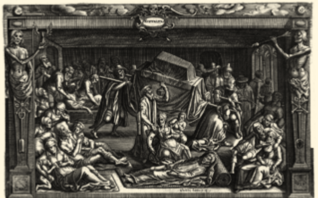
Эпидемия в осаждённом Лейдене во время 80-летней войны. Гравюра XVII века

ма и ощущение близкой смерти в 1630-е годы подтолкнули голландцев к риску и сняли запреты, которые удерживали их от необдуманных спекуляций, связанных с куплей и продажей луковиц тюльпанов.