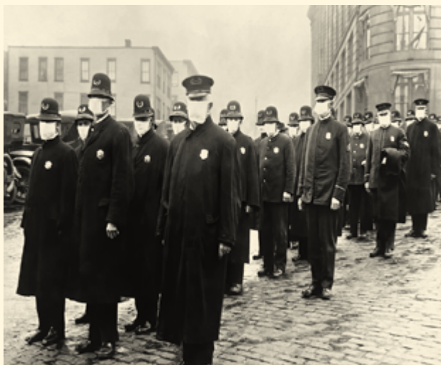
Полицейские Сизтла выходят на дежурство во время эпидемии «испанки», 1918

Вирус Эбола был открыт в 1970-е годы, но массово уносить жизни стал в 2013-м. Вспышку болезни, приведшей к лихорадке, первоначально зафиксировали в Западной Африке. Вирус передавался людям от летучих мышей. Лихорадка Эбола унесла жизни 11 тыс. человек из 27 тыс. заражённых. В некоторых очагах смертельный финал наблюдался в 90% случаев. Эпидемия Эболы нанесла существенный ущерб экономикам Западной Африки. Президент Гвинейской республики Альфа Конде в 2016 году сообщал, что из-за вируса его страна потеряла около $2 млрд, или около трети объёма ВВП. Государство оказалось в изоляции, были нарушены торговые связи, импортёры отказывались от товаров. В Либерии из-за эпидемии рынок потерял до 50–75% оборота. Карантин и ограничения в передвижении рабочей силы негативно повлияли на сбор урожая и работу фермерских хозяйств, что в итоге способствовало дефициту продовольствия и росту цен на 40%.