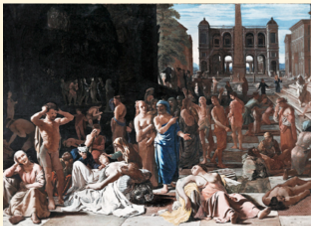
«Чума в Афинах в V веке до н. э.», Михаэль Свертс, 1653

смерти. Политическими последствиями эпидемии стали приход к власти «тридцати тиранов», а также подъём города Фивы — одного из главных торговых конкурентов Афин.