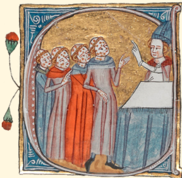
Священник наставляет паству о способах лечения во время эпидемии, XIV век

лама — на фоне разочарования населения в прежних религиозных культах. Некоторые историки считают, что после окончания эпидемии, когда существенно сократилась численность населения Средиземноморья, произошёл рост среднедушевого дохода из-за дефицита рабочей силы — что также стимулировало спрос на дорогие товары и предметы роскоши и в дальнейшем способствовало развитию торговли со странами Востока.