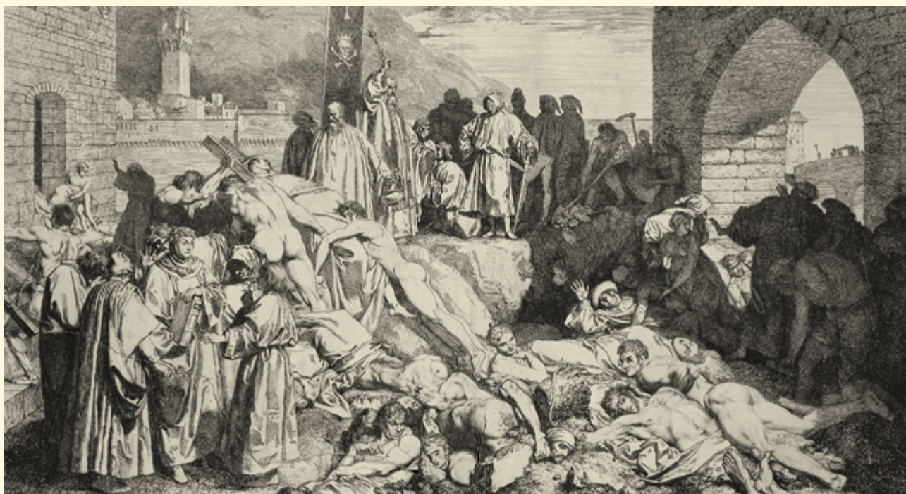
Эпидемия чумы 1348 года во Флоренции стала историческим фоном для «Декамерона» Джованни Боккаччо

В Италии многие дома стояли пустыми. Знаменитое флорентийское ткачество сократилось в четыре раза. Горожане в основном вкладывали деньги в землю, скупая наделы разорившихся. Спасением становилась любая попытка отгородиться — и многие знатные семьи уезжали в провинцию.