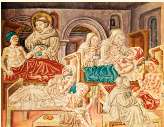
Жертвы чумы в Перудже, XVI век

Ярким литературным памятником, описывающим нравы и умонастроения общества в тот период, стал «Декамерон» Джованни Боккаччо (1313–1375). События этой книги относятся к времени чумы 1348 года: группа флорентийских благородных юношей и дам спасается от поветрия на загородной вилле, где они проводят в самоизоляции 10 дней, развлекаая друг друга занимательными историями.