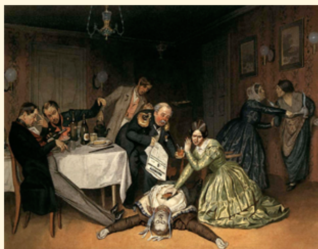
«Всё холера виновата», Павел Федотов, 1848. Картина изображает перебравшего спиртного гостя на пирушке в период эпидемии холеры

в среднем эта эпидемия стоила миру примерно 6,6% тогдашнего ВВП. Современники отмечали, что торговля в ряде стран из-за «испанки» упала на 40%, а по некоторым оценкам падение составило 70%. По заключению Всемирного банка, в настоящее время эпидемия подобного масштаба могла бы обойтись мировой экономике в 4,8% ВВП, а её ущерб составил бы больше $3 трлн. Вместе с тем ряд экономистов отмечает, что сокращение работоспособного населения после эпидемии «испанки» привело к существенному росту подушевого реального дохода в США в 1920-е годы, когда в стране наступило время экономического процветания.