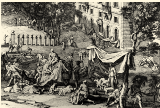
Великая чума в Марселе 1720 года

чтобы избежать паники, и не стали закрывать порт, опасаясь потерять доходы от торговли. Однако ущерб от чумы оказался ещё выше, поскольку время для борьбы с эпидемией было упущено.