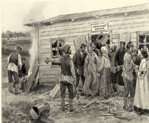
Сцена у холерного барака. Иван Владимиров, акварель, 1920

Американские экономисты XX века связывали с эпидемией «испанки» рецессию в ряде капиталистических стран в 1919–1921 годах (по некоторым оценкам, четвертая по экономическим последствиям катастрофа XX века — после Первой и Второй мировых войн и Великой депрессии). Высказывались мнения, по которым