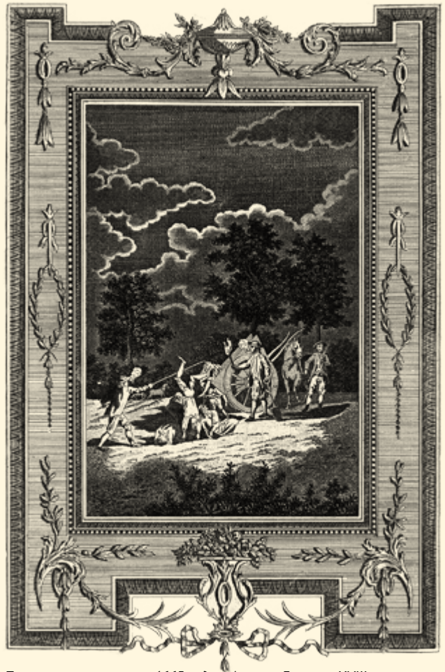
Похороны жертв чумы 1665 года в Англии. Гравюра XVIII века

Эпидемии чумы приводили и к росту спекуляций. В 1623–1625 годах, а также в 1635-м Нидерланды пережили очередную эпидемию чумы. В одном только 1635 году в городе Лейдене погибла треть населения. Историки прослеживают косвенную связь эпидемии и знаменитой тюльпаномании. По всей видимости, чу-