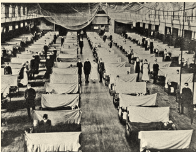
Склад Нью-Йорка, переоборудованный под инфекционную больницу, 1918

Риск закрытия границ из-за эпидемии Эболы вызвал уменьшение поездок по миру. Из-за эпидемии упали акции американских и британских авиакомпаний, понесли убытки сети отелей и западные компании, которые занимались торговлей в Африке. Разорились и горнорудные компании, действовавшие в Западной Африке.