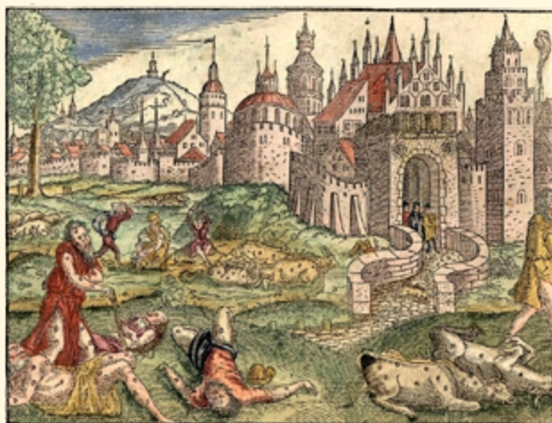
Шестая казнь Египетская – моровое поветрие. Изображение из Библии XVI века

Эпидемия чумы XIV века привела к нарушению торговых связей, которые формировались в течение длительного времени. Например, до пандемии запретов на перемещение людей внутри Европы было мало. По-