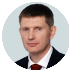
Максим Решетников, Министр экономического развития Российской Федерации

И, наконец, ещё один объект повышенного внимания в последнее время — проценты по вкладам (+84% упоминаний). Средневзвешенные процентные ставки по депозитам в российских банках, по данным Центробанка РФ, за год снизились более чем на 1,5 процентных пункта. Это заставляет граждан искать более потенциально выгодные (и одновременно более рискованные) способы приумножения сбережений. В недавнем исследовании компании «Сбербанк Управле-