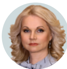
Татьяна Голикова, Заместитель Председателя Правительства Российской Федерации

Мы всегда руководствуемся тем, что если все мы соблюдаем и требования главных санитарных врачей, и требования к общежитию, к которому мы стремимся, чтобы не заразить наших близких, не допустить какого-то неконтролируемого распространения инфекции, то мы очень надеемся, что летом наша жизнь наладится и мы будем чаще контактировать друг с другом.