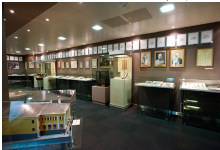
Музей биржевого дела

Музей биржевого дела при Московской бирже, созданный в 2002 году, — единственный в своём роде в России. Среди экспонатов — документы, связанные с функционированием биржи, коллекции ценных бумаг, рублёвых монет, видеофильмы о работе российских бирж, предметы специфического биржевого обихода. С должным почтением здесь прослеживается история появления и обращения ценных бумаг. В частности, много внимания уделяется их роли при проведении денежных реформ в стране. «Многие не знают, например, что именно благодаря выпуску ценных бумаг в России были построены железные дороги — кровеносные сосуды экономики», — отмечает руководитель музея и член экспертного совета по финансовой грамотности при Банке