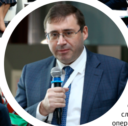
Первый зампредела Банка России Сергей Швецов

финансовых продуктов. В ряде регионов ситуация до начала реализации Проекта была близка к критической: фиксировались многочисленные случаи обмана (например, пайщиков кооперативов), всплески социальной напряжённости — вплоть до перекрытия автотрасс.